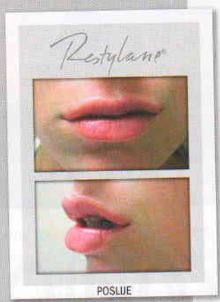
Zahvaljujući novim ikonama ljepote 21. stoljeća, putene usne i sjajna, glatka koža - san su svake žene bez obzira na dob.